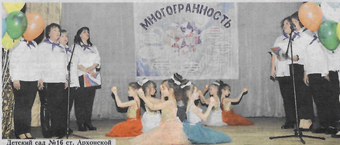
Детский сад №16 ст. Архонской