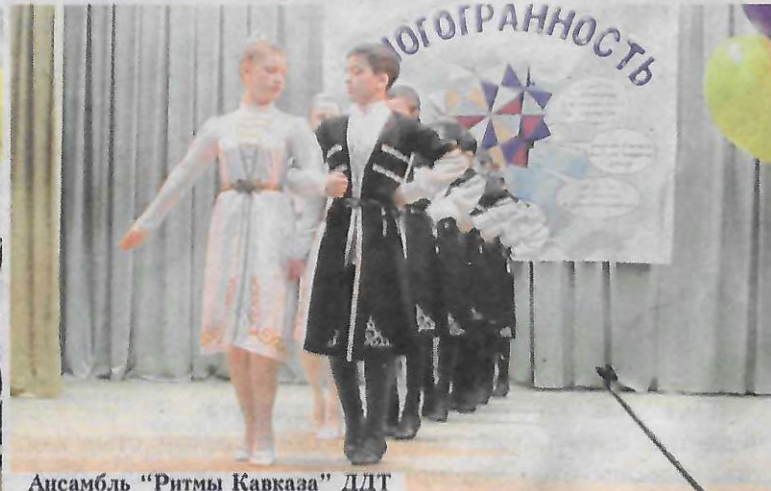
Ансамбль “Ритмы Кавказа” ДДТ

Цель фестиваля - привлечь внимание участников образовательного процесса к возрождению престижа профессии педагога; выявить многогранность талантов работников образо-